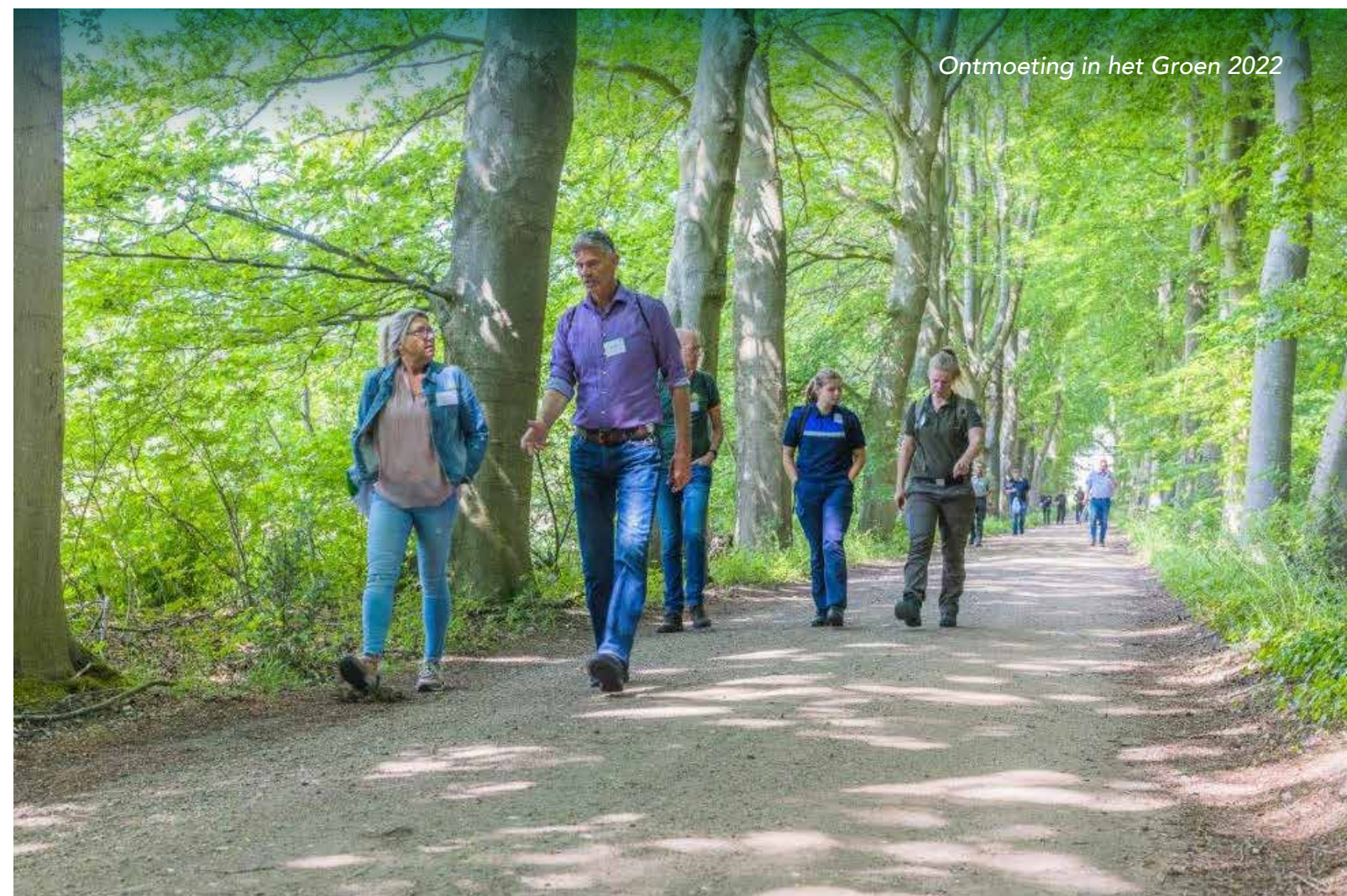
Ontmoeting in het Groen 2022

Ook hebben we het rijk hard nodig om groene boa's zo goed mogelijk te ondersteunen door het wegnemen van ervaren blokkades. We zullen ook naar de toekomst toe niet alles kunnen oplossen, dus het blijft ook zaak realistische verwachtingen te houden en de misstanden beheersbaar te houden, door onder meer stevig op te treden tegen de speerpunten.