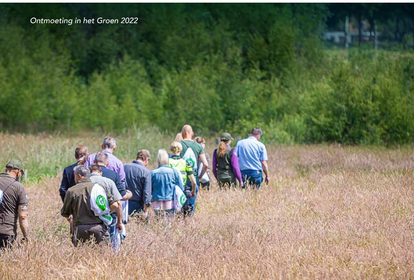
Ontmoeting in het Groen 2022

De gevolgen voor de SSiB-organisatie zijn niet enkel afhankelijk van de visie, maar vooral van besluitvorming over financiële bijdragen ter vervanging van de aflopende provinciale versterkingsmiddelen. De visie biedt houvast om de gevolgen voor de SSiB-organisatie in kaart te brengen. Afhankelijk van de besluitvorming kan dit verder worden uitgewerkt en een plek krijgen in het nieuwe werkprogramma SSiB 2024.